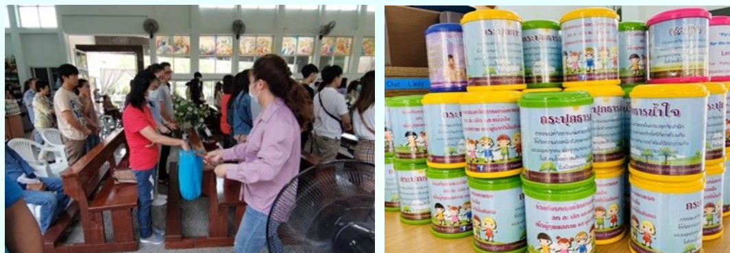
(กรุณานำมาส่งคืนอย่างช้าวันอาทิตย์ปีสกา)